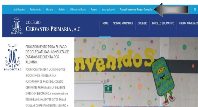
IMAGEN EN INTERNET